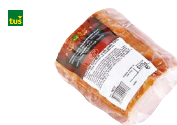
PEČENA ŠUNKA V MREŽI TUŠ • vakuumsko pakirani kosi • cena za 1 kg