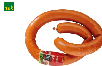
KLOBASA AVE RADOST • postrežno • cena za 1 kg