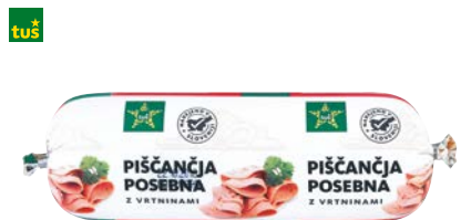
PIŠČANČJA POSEBNA Z VRTINAMI TUŠ • 500 g