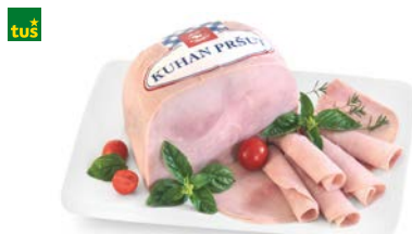
KUHANA PRŠUT MIP • postrežno • cena za 1 kg