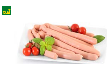
FRANKFURTER XXL AVE • postrežno • cena za 1 kg