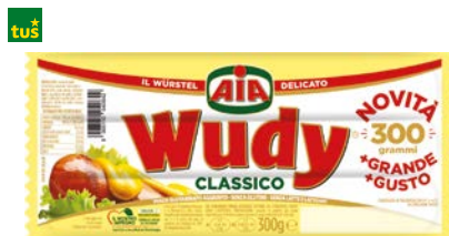
PERUTNINSKA KLOBASA WUDY CLASSIC • 300 g