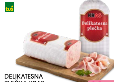
DELIKATESNA PLEČKA KRAS • postrežno • cena za 1 kg