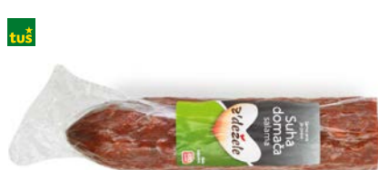
SUHA DOMAČA SALAMA Z'DEŽELE • 500 g