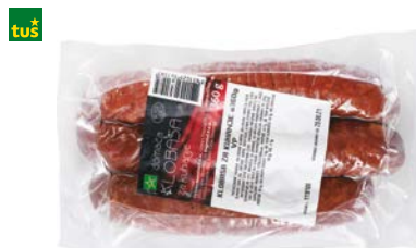
DOMAČA KLOBASA ZA KUHANJE TUŠ • 360 g