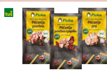
NAREZEK PIVKA • več vrst • različnih gramatur Redna cena od 1,49 €