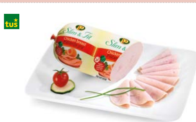
PIŠČANČJE PRSI SLIM&FIT • postrežno • cena za 1 kg