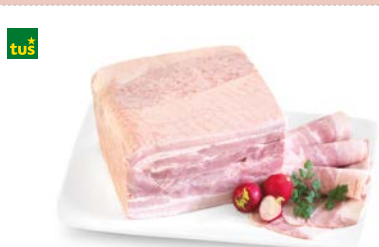
MESNATA KUHANA SLANINA ANTON • postrežno • cena za 1 kg